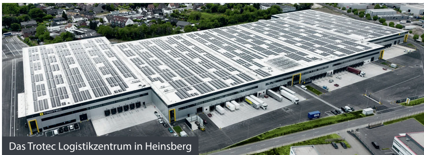
Das Trotec Logistikzentrum in Heinsberg

Für Arbeitnehmer*innen und Berufseinsteiger*innen bieten sich bei uns interessante Karrierechancen – regional sowie international! Die Vorteile eines großen Konzerns spiegeln sich auch in der neuen Unternehmenskultur und den Mitarbeiter-Benefits wider. Wir suchen ständig Unterstützung in vielfältigen Aufgabenbereichen! Infos zu unseren aktuellen Stellenangeboten gibt es auf trotec.heyrecruit.de .