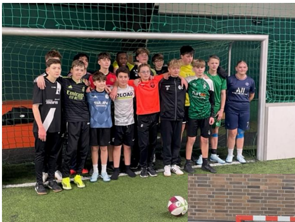
C 1 Jugend