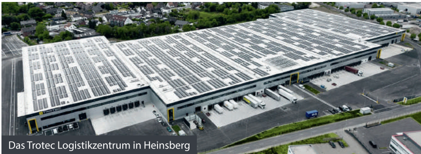
Das Trotec Logistikzentrum in Heinsberg

Für Arbeitnehmer*innen und Berufseinsteiger*innen bieten sich bei uns interessante Karrierechancen – regional sowie international! Die Vorteile eines großen Konzerns spiegeln sich auch in der neuen Unternehmenskultur und den Mitarbeiter-Benefits wider. Wir suchen ständig Unterstützung in vielfältigen Aufgabenbereichen! Infos zu unseren aktuellen Stellenangeboten gibt es auf trotec.heyrecruit.de .